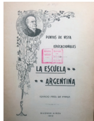
Fig. 16.- Un dos textos escritos por Ignacio Ares de Parga, plenamente introducido nos debates educativos arxentinos.