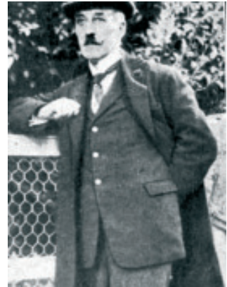
Fig. 15.- Ignacio Ares de Parga, ilustre pedagogo, institucionista, republicano, ligado ás Escolas da Unión pro Valle Miñor.

1º. Cada asignatura estaba dividida en partes o asuntos por su orden natural. Cada asunto estaba a su vez logicamente dividido y subdividido hasta que a cada lección no correspondiera sino «una idea nueva»; y tan sencillamente dispuesta cada lección que el maestro podía dar todas las explicaciones y presentar todos los ejemplos necesarios para que los alumnos la aprendieran como era debido.