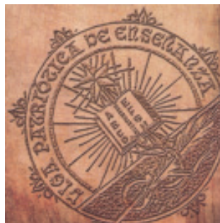
Fig. 1.- A Liga Patriótica de Enseñanza de Uruguay impulsou a educación.

Outras medidas ao longo dos anos vinte e trinta favoreceron a mellor cualificación técnico pedagóxica do sistema educativo arxentino, tratando de facer das escolas unha