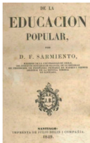
Fig. 2.- D. Faustino Sarmiento promoveu intensamente o desenvolvemento educacional arxentino.